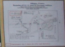
Location of the memorial and surrounding areas.