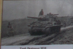
Tank Destroyer M10