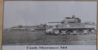
Tank Sherman M4